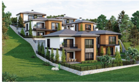
Sarıca Villaları - 2