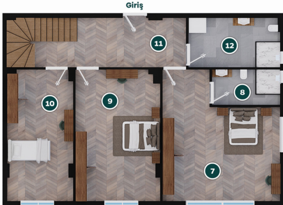
Villa Üst Kat