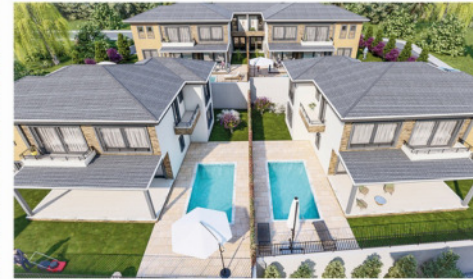
Sarıca Villaları - 3 Excellence