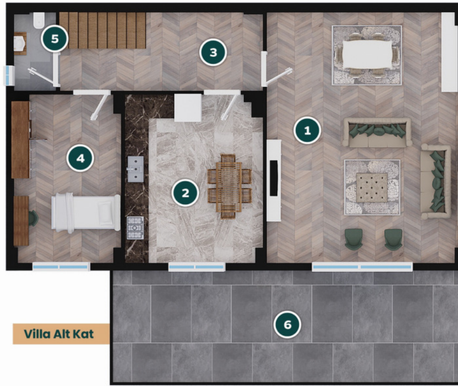
Villa Alt Kat