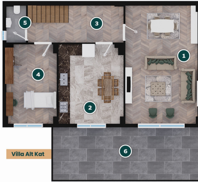
Villa Alt Kat