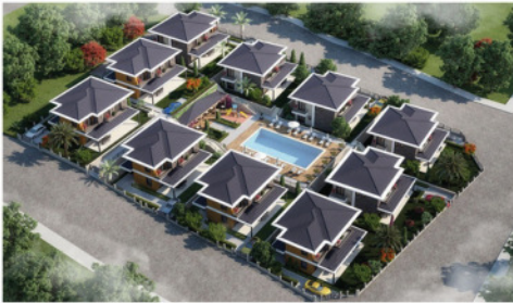
Sarıca Villaları - 1

Sarıca Villaları 4.etap, bu anlayışın en prestijli örneklerinden biridir.