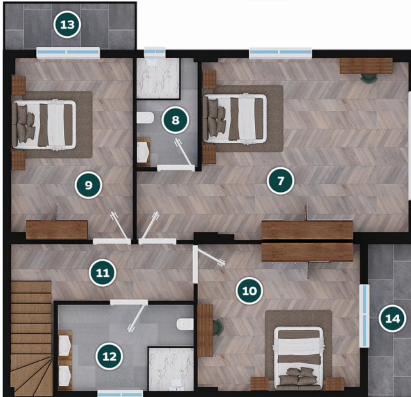
Villa Üst Kat