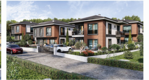
Sarıca Villaları - 4 Premium

Bu katalogta yer alan, ve taahhüt edilen malzemeler, teknik şartnamede belirtilmiş olup, katalogta yer alan görseller tanıtım amaçlıdır. NÖTR İNŞAAT renk ve malzeme değişikliği yapma hakkını saklı tutar.